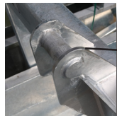
Optioneel: HD beugel.

De gecertificeerde kraancontainer Type A 1000ltr 2000kg geeft de kraanmachinist de mogelijkheid het lossen alleen te verrichten. De kraancontainer is toepasbaar voor diverse soorten kranen en/of andere hef/hijs machines voorzien van hijsketting.